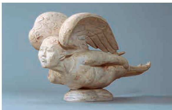
「迦陵頻伽」 田中太郎作 当館蔵