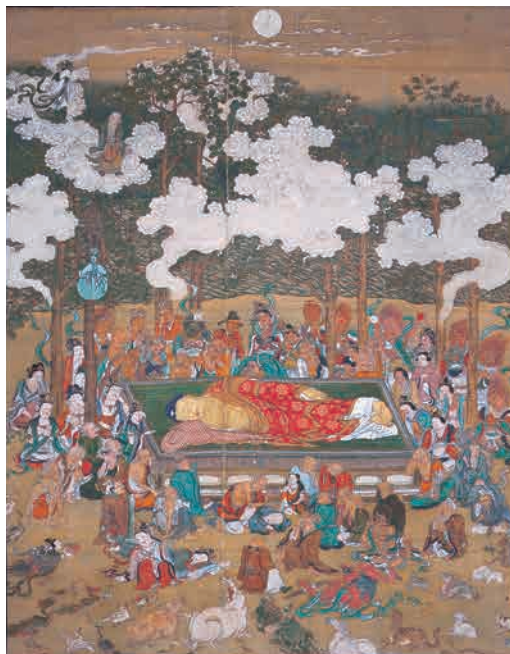
△「仏涅槃図」 長谷川等誓筆 七尾市・東嶺寺蔵