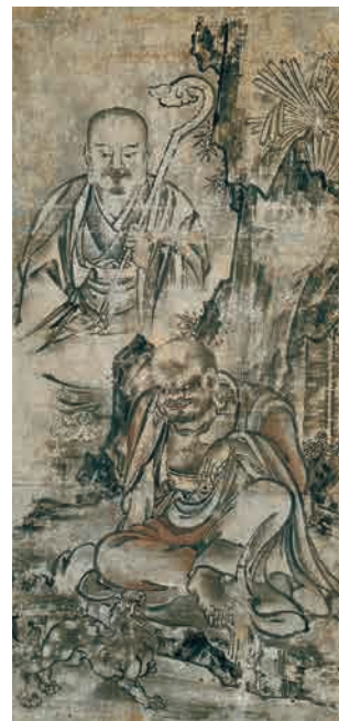
□「十六羅漢図」(部分) 長谷川信春(等伯)筆 七尾市・靈泉寺蔵