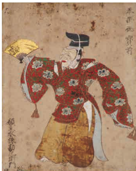
△「総社三番叢図額」(部分) 狩野長兵衛筆 七尾市・古府町会蔵