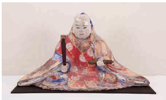
△「日蓮聖人坐像」 長谷川信春(等伯)彩色 七尾市・本延寺蔵

能登七尾出身で桃山時代に大活躍した絵師・長谷川等伯(1539～1610)や、能登の「長谷川派」絵師の仏画などもあわせて展示。これらの貴重な品々をとoshite、当地域で脈々と受け継がれる「いのりの心」を感じ取っていただければ幸いです。