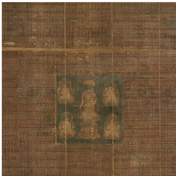
△「三千仏画像」 七尾市・印鐘神社蔵